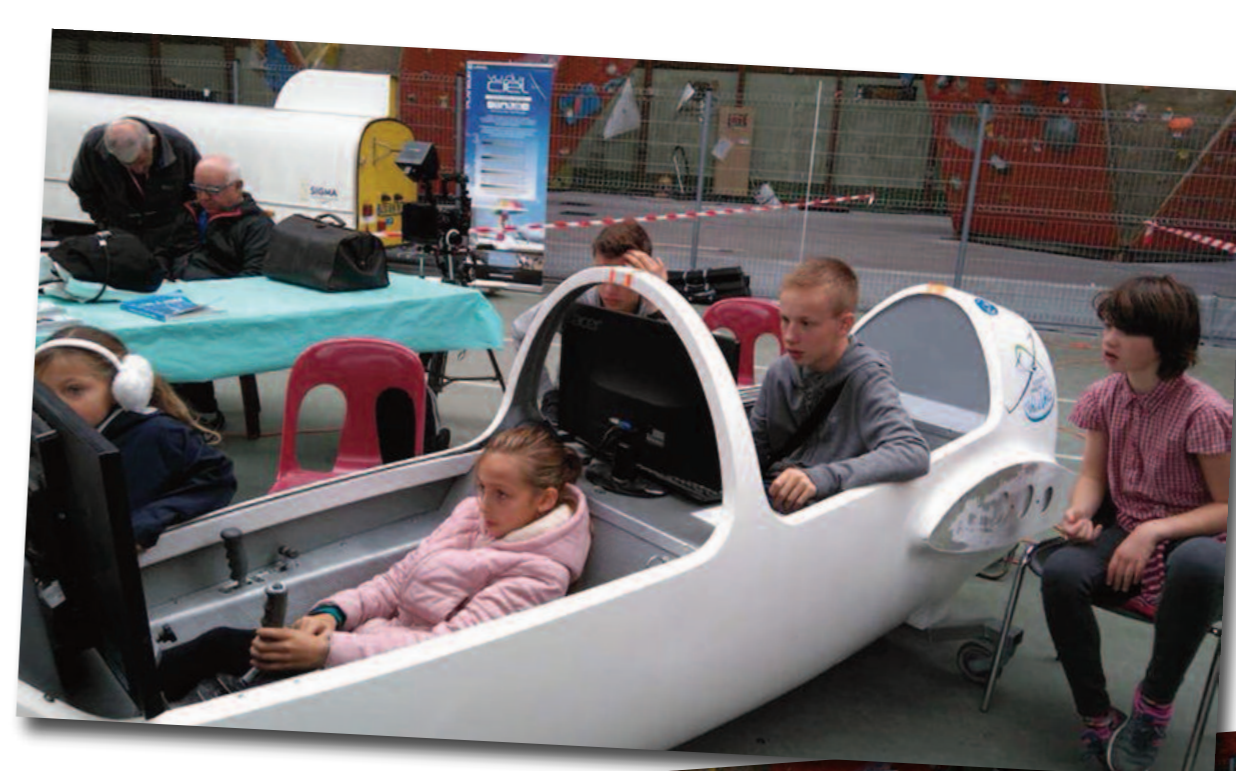
Le simu en "plein vol"...

sans -Frontières, l'Aéro-Club de France, des modèles réduits et l'AAVE... Le club était ainsi présent avec le Pégase BBX, son simulateur et des panneaux d'affichage. Pendant ces trois jours, de nombreux membres ont assumé l'animation du stand en fournissant commentaires et/ou explications sur notre sport. Le simulateur n'a pratiquement pas désempilé en particulier par des jeunes, voire très jeunes. Les contacts avec le public laissent espérer des retombées à travers des VI ou des adhésions. Notre terrain, bien que limitrophe de la Seine-et-Marne est trop peu présent sur ce territoire en terme de promotion. Pour les habitants du sud de ce département, il n'est géographiquement pas plus éloigné que Moret. Cette exposition, en principe renouvelable tous les deux ans, peut contribuer à rétablir un certain équilibre. ■ Pierre Piétu