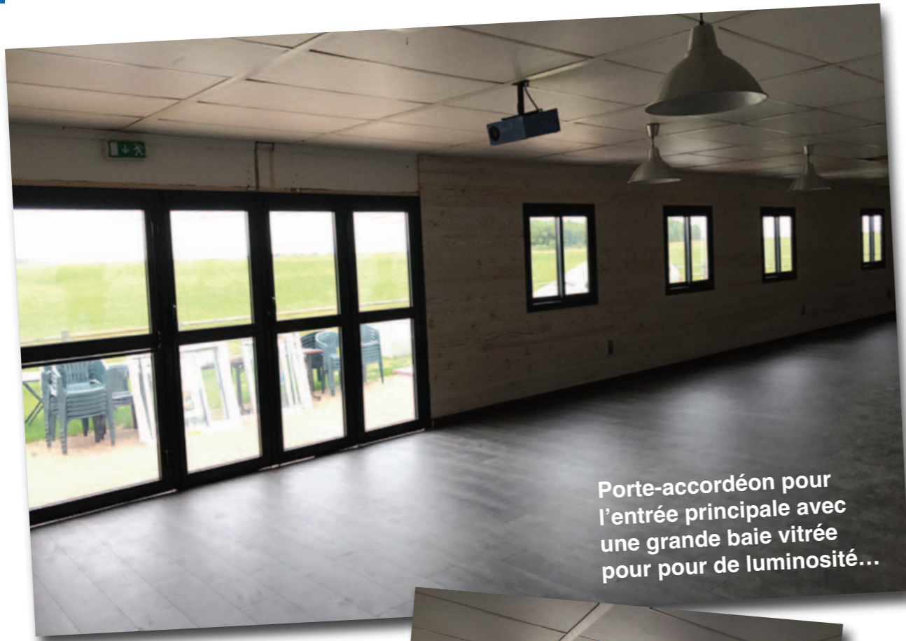
Porte-accordéon pour l'entrée principale avec une grande baie vitrée pour pour de luminosité...