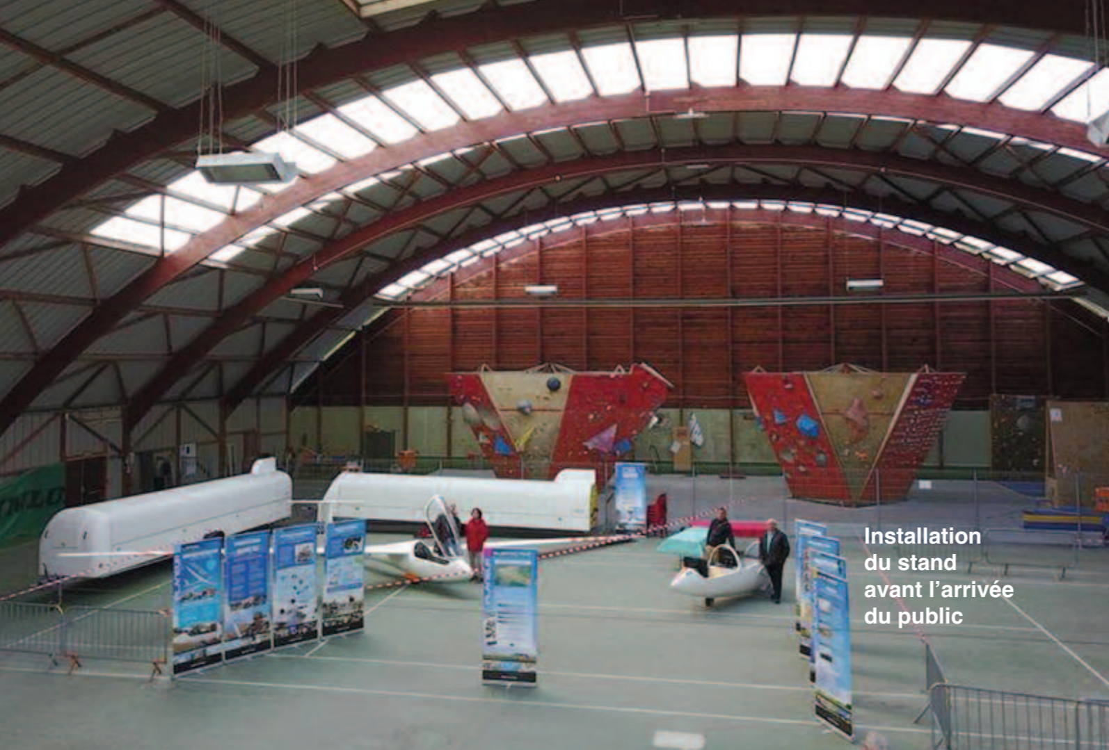
Installation du stand avant l'arrivée du public