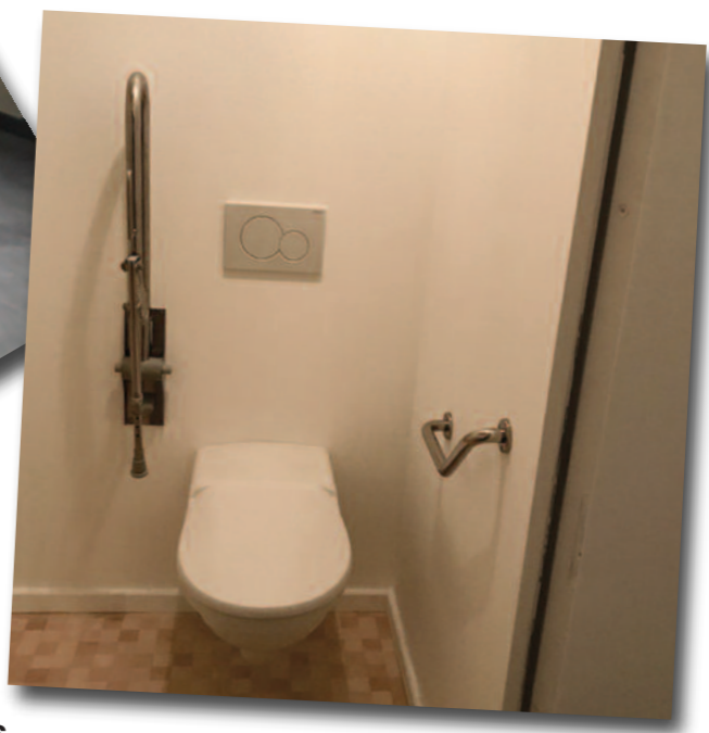
Toilettes aux normes personnes handicapées