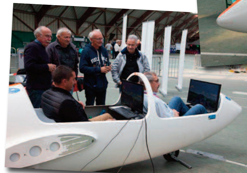
Merci aux bénévoles du club pour l'animation du stand de l'AAVE